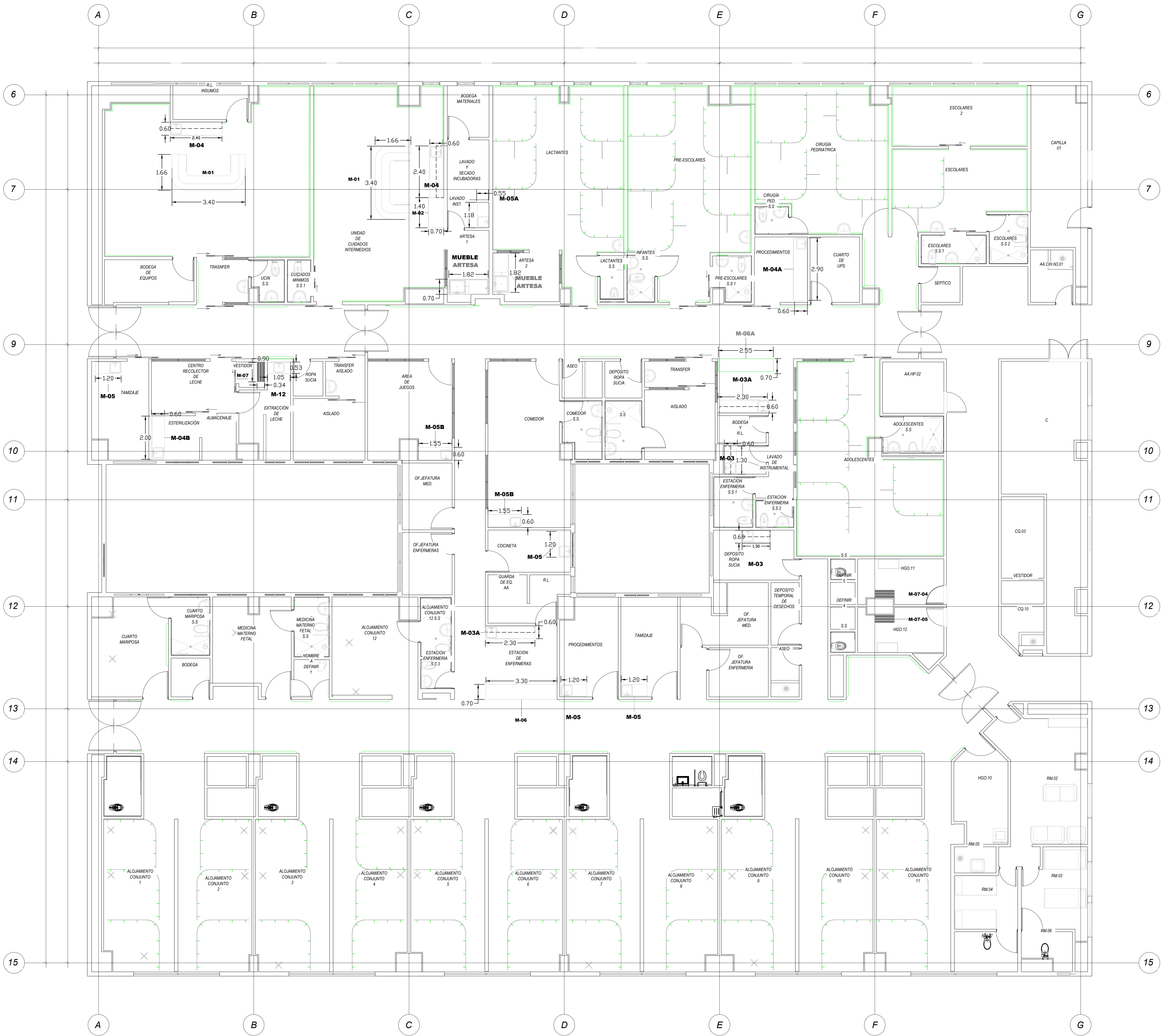
1 PLANTA MOBILIARIO FIJO, MODULO 2 NIVEL 3 1 : 75