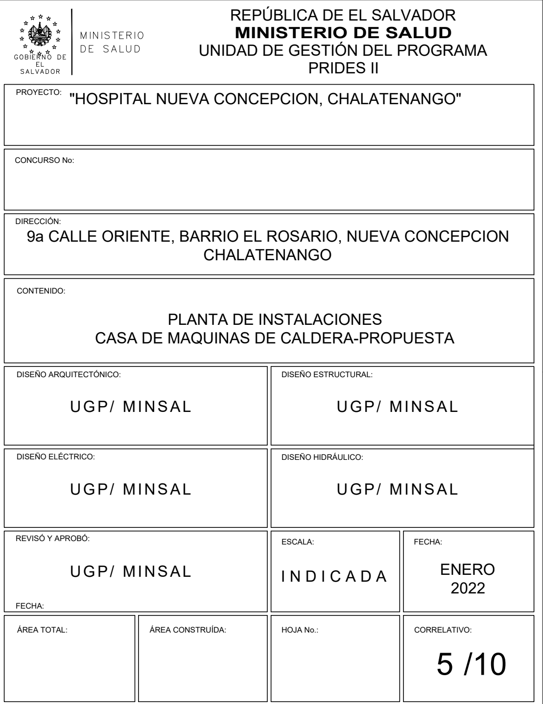
PLANTA DE CASA DE MAQUINAS DE CALDERA HOSPITAL DE NUEVA CONCEPCION Esc: 1:25