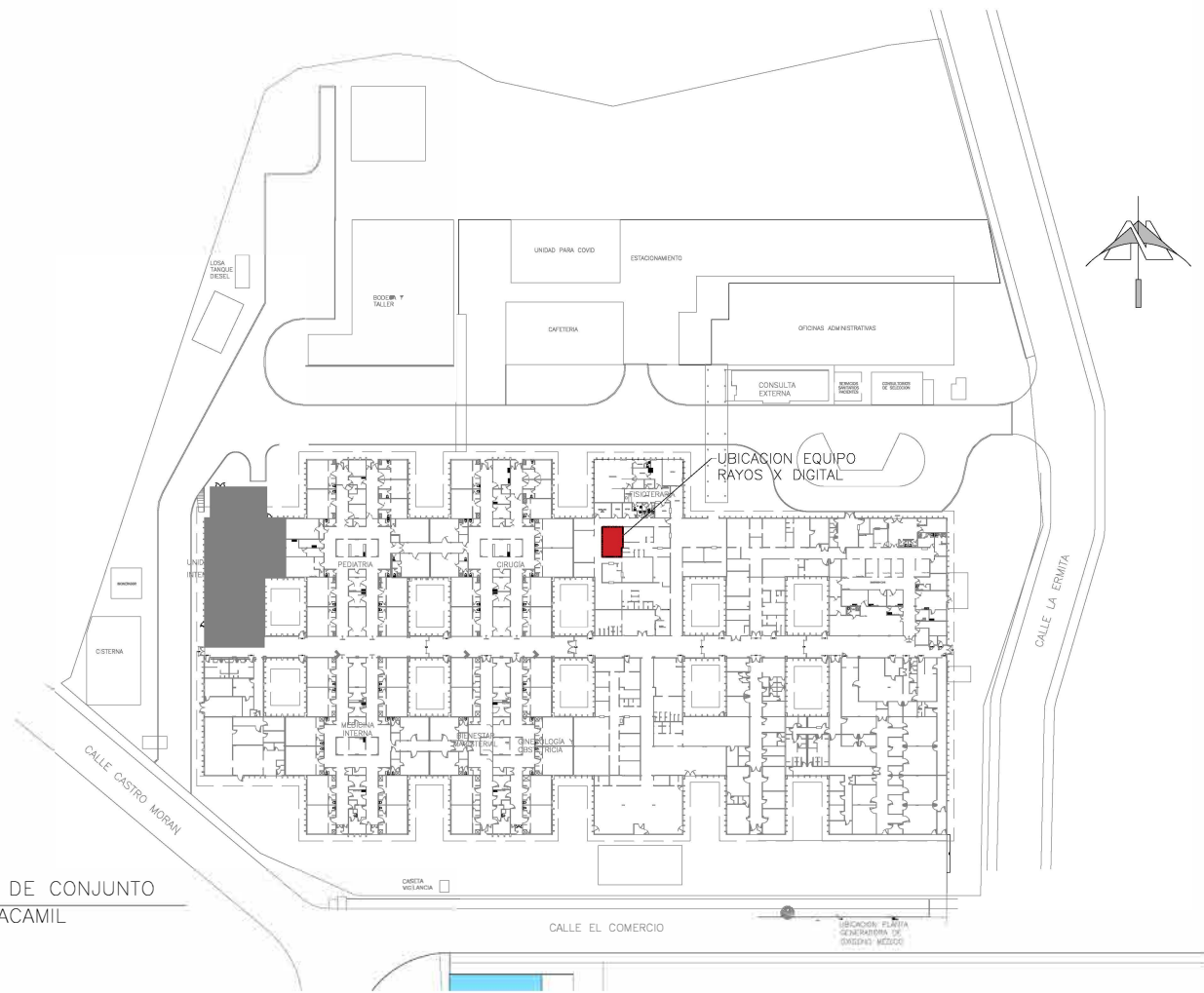
PLANTA DE UBICACION DE CONJUNTO HOSPITAL NACIONAL ZACAMIL SIN ESC.