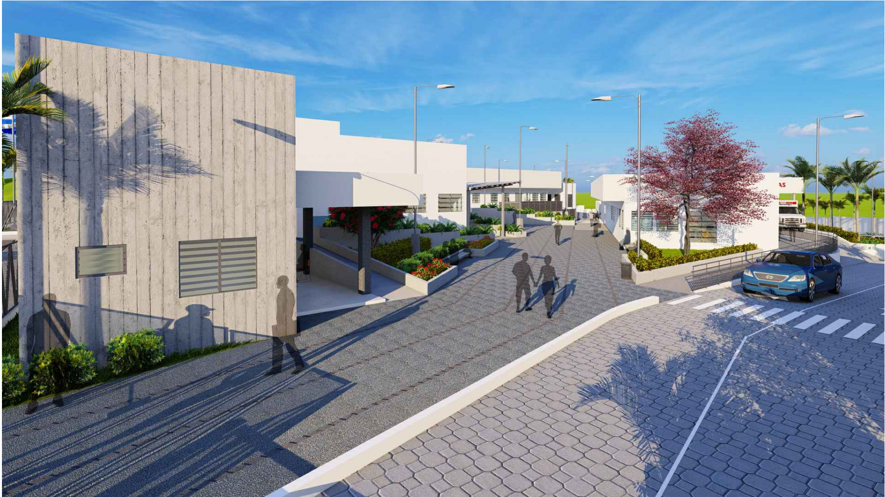
PERSPECTIVA HACIA ACCESO PEATONAL Y VEHICULAR