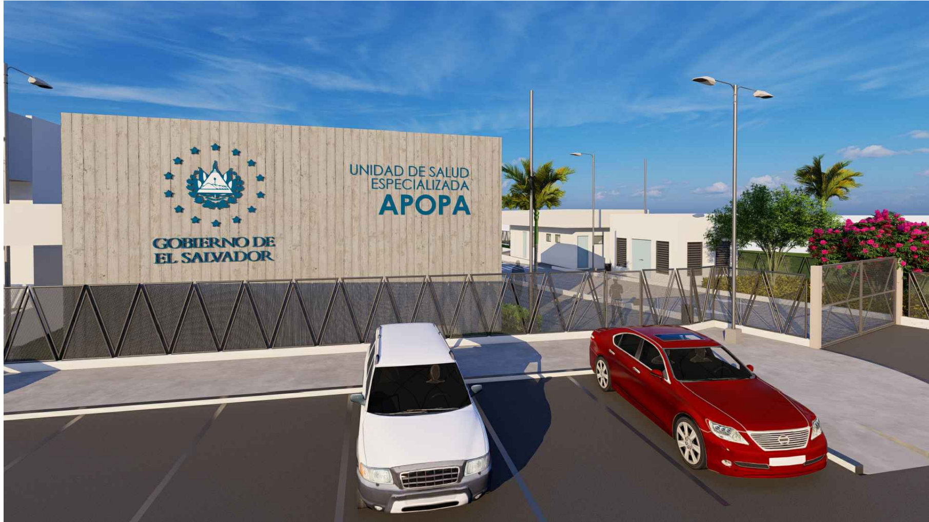
PERSPECTIVA HACIA ACCESO PEATONAL Y VEHICULAR