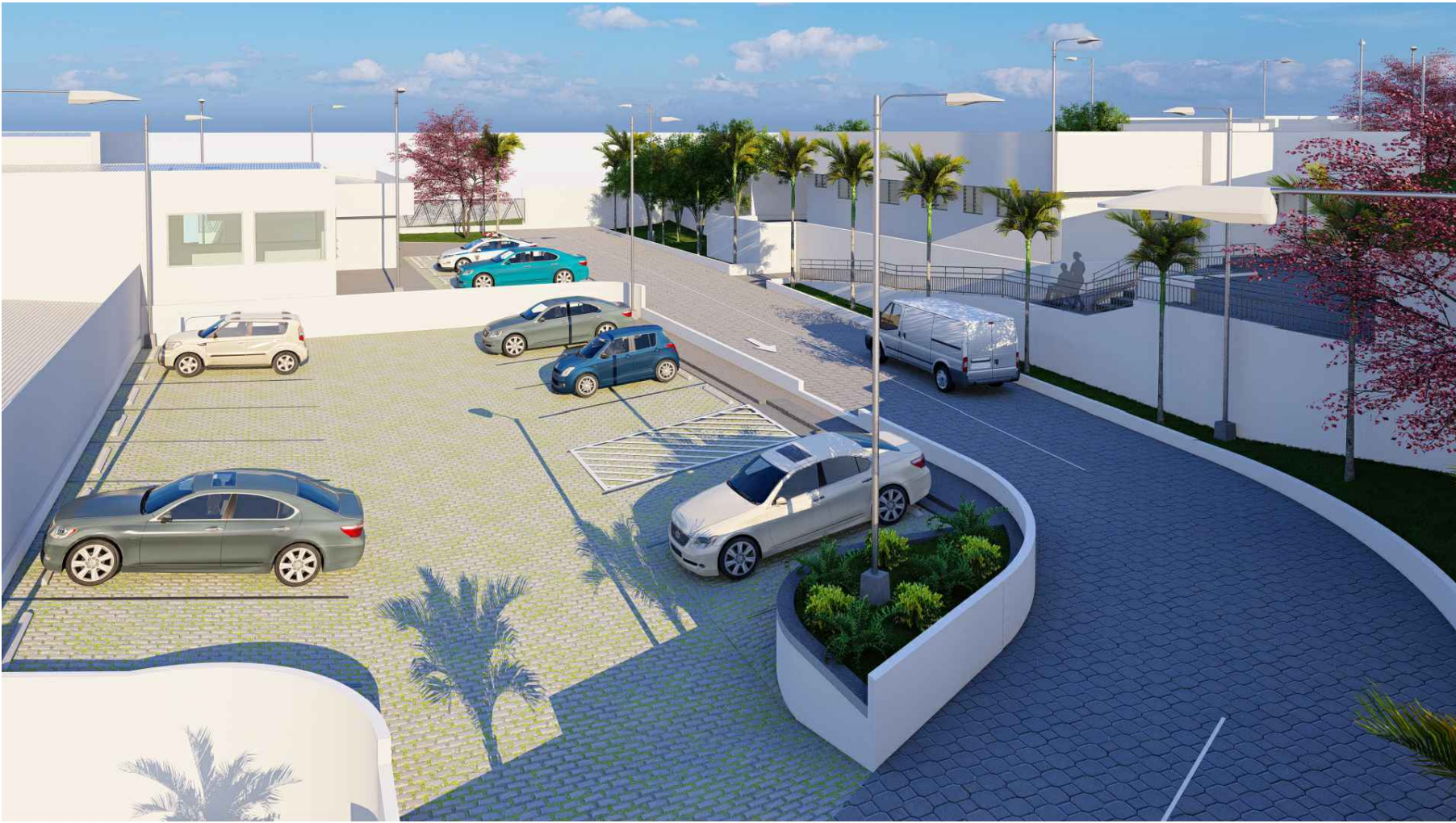
PERSPECTIVA HACIA ESTACIONAMIENTO DE PERSONAL DE SIBASI