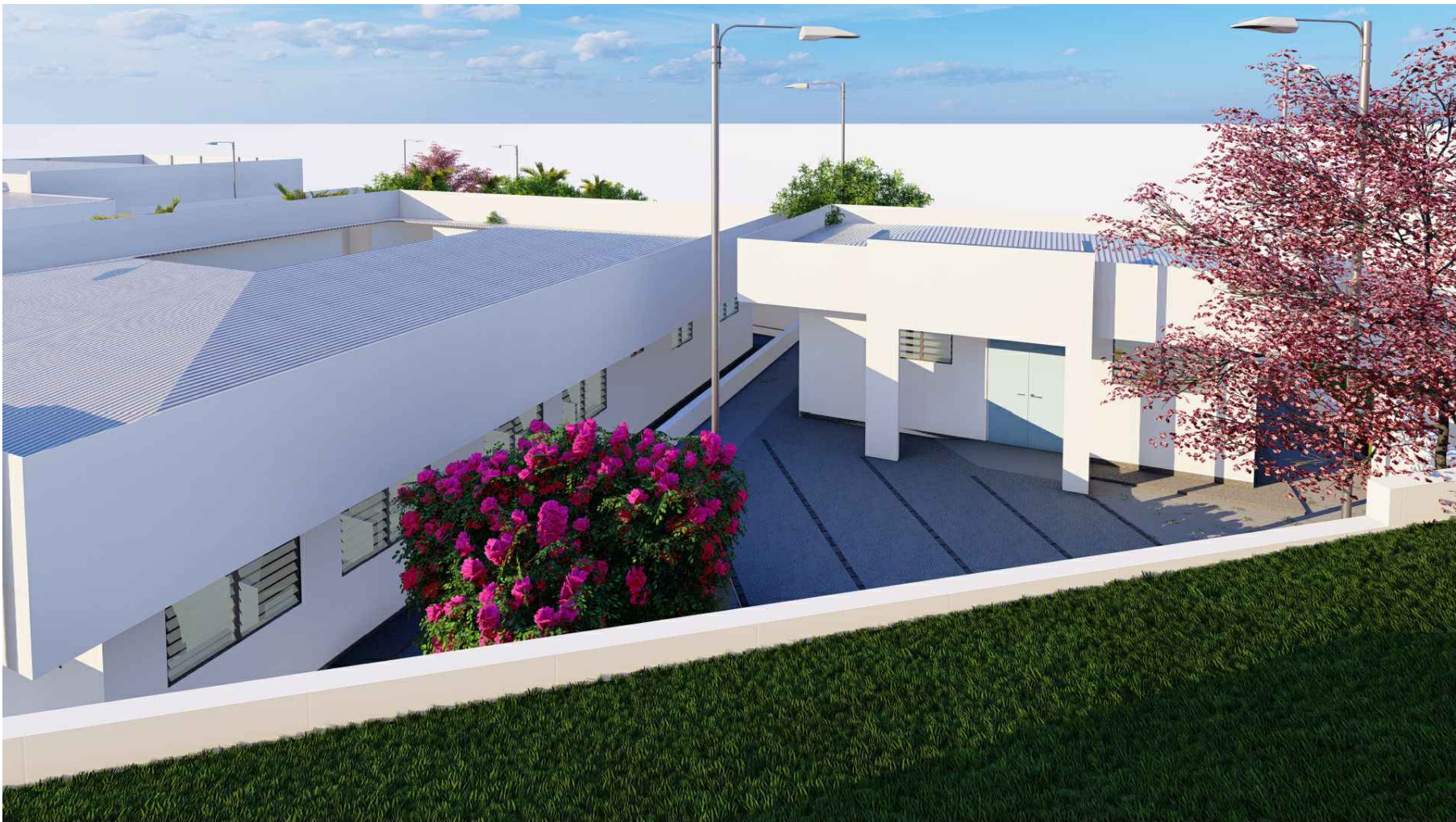
PERSPECTIVA HACIA SIBASI Y SALÓN DE USOS MÚLTIPLES SIBASI