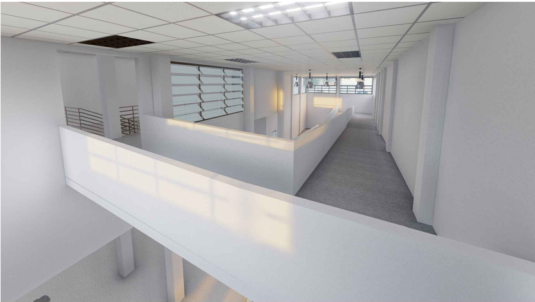
PERSPECTIVA HACIA RAMPA MÓDULO 1