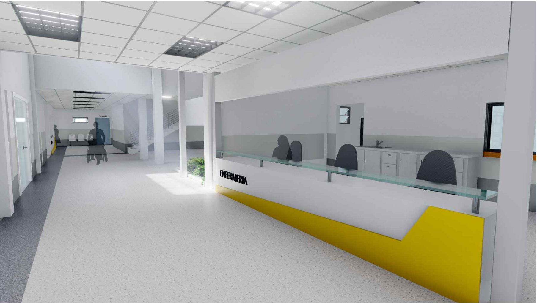
PERSPECTIVA HACIA ESTACIÓN DE ENFERMERÍA Y PASILLO PRINCIPAL MÓDULO 1