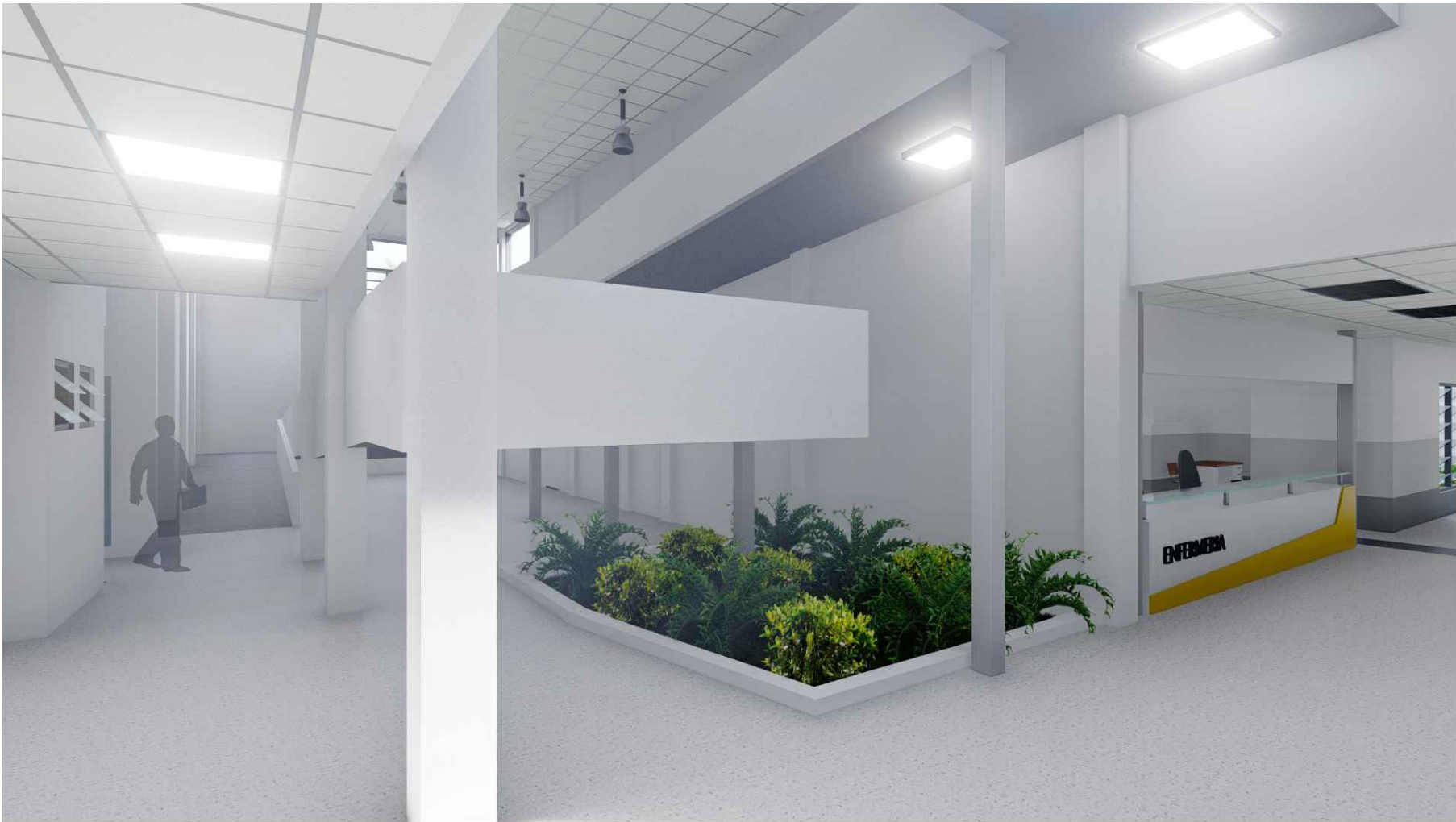
PERSPECTIVA HACIA RAMPA DE ACCESO A SEGUNDO NIVEL MÓDULO 1