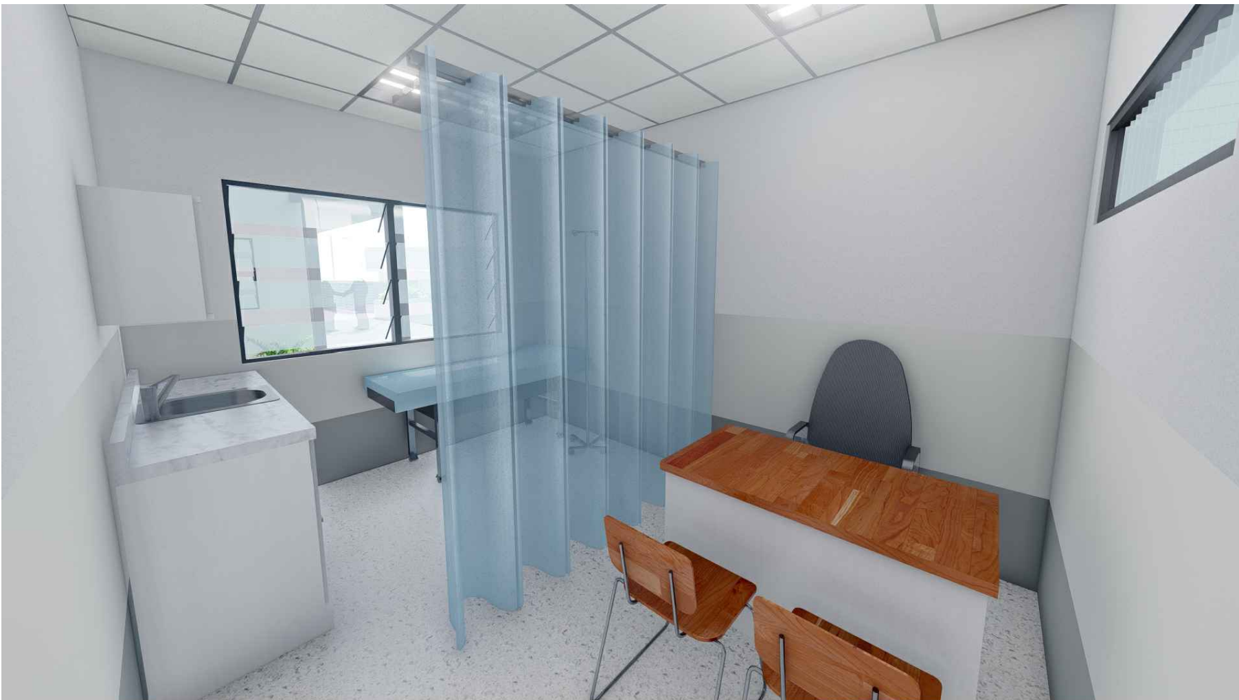
PERSPECTIVA DE CONSULTORIO GENERAL MÓDULO 1