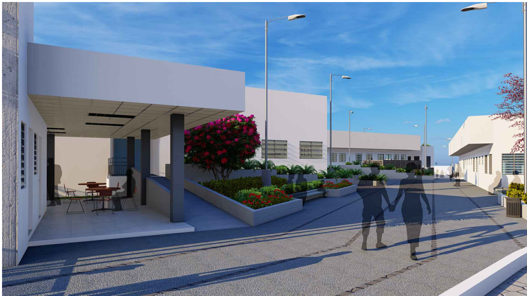
PERSPECTIVA DE ACCESO HACIA CAFETERÍA, MÓDULO PRINCIPAL Y EMERGENCIA