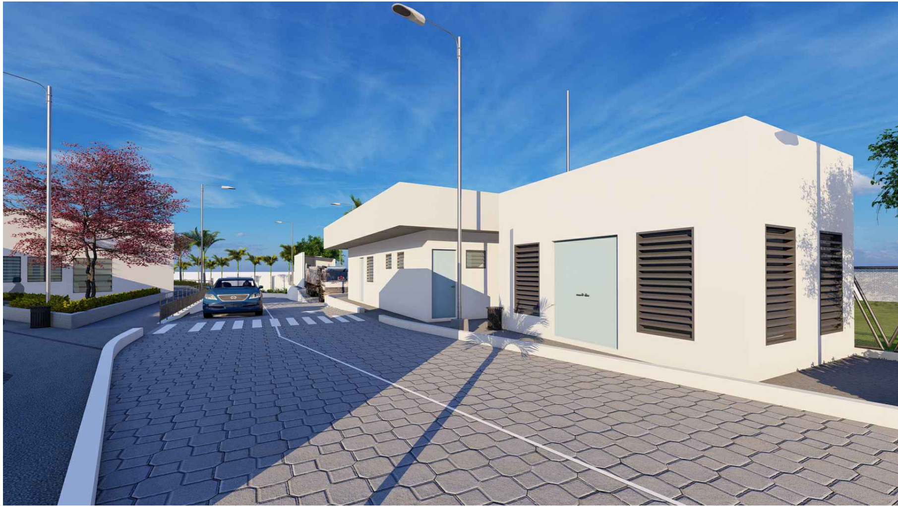
PERSPECTIVA HACIA CASETA DE MÁQUINAS Y SANEAMIENTO