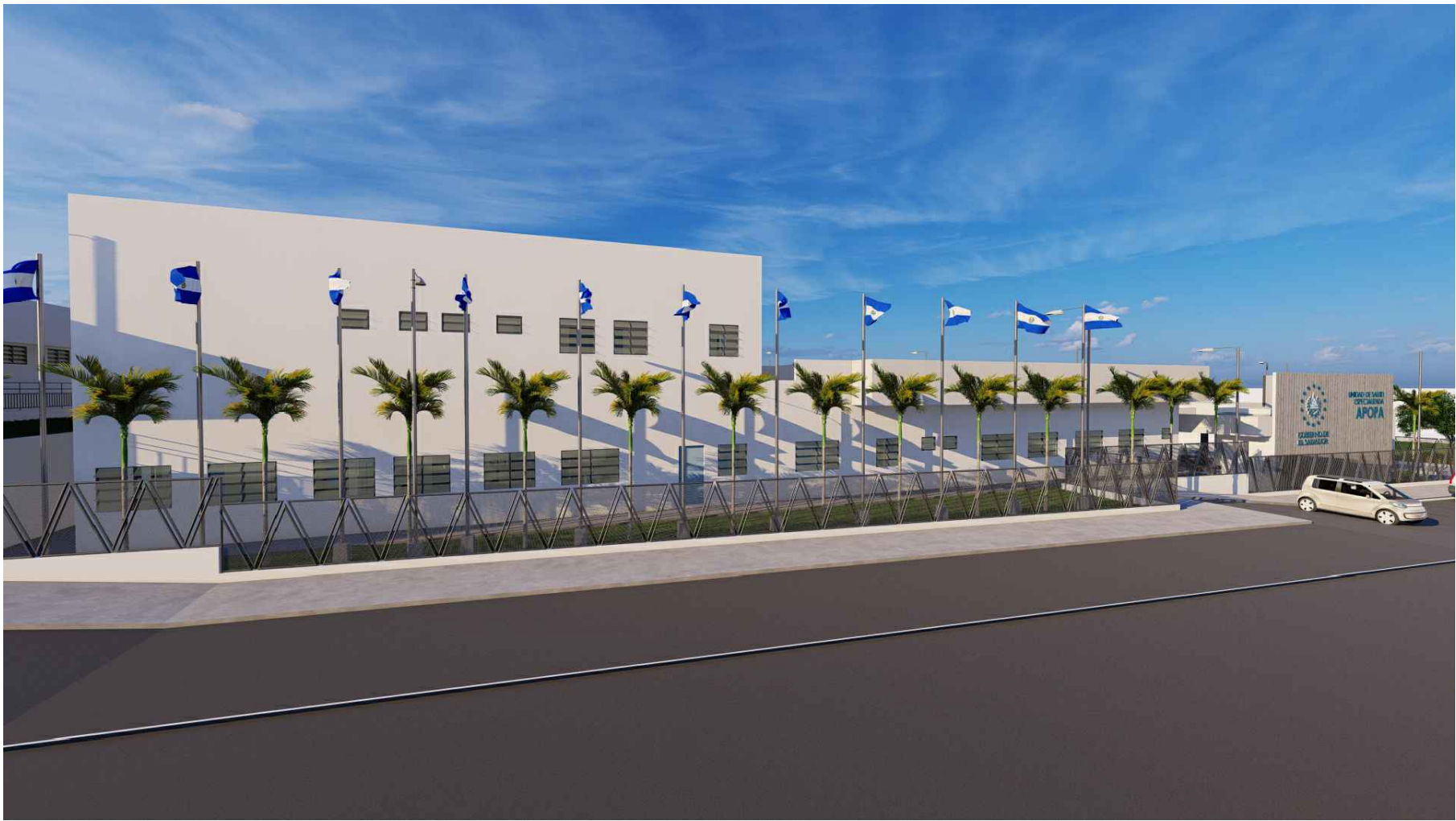
PERSPECTIVA HACIA ACCESO PEATONAL Y VEHICULAR