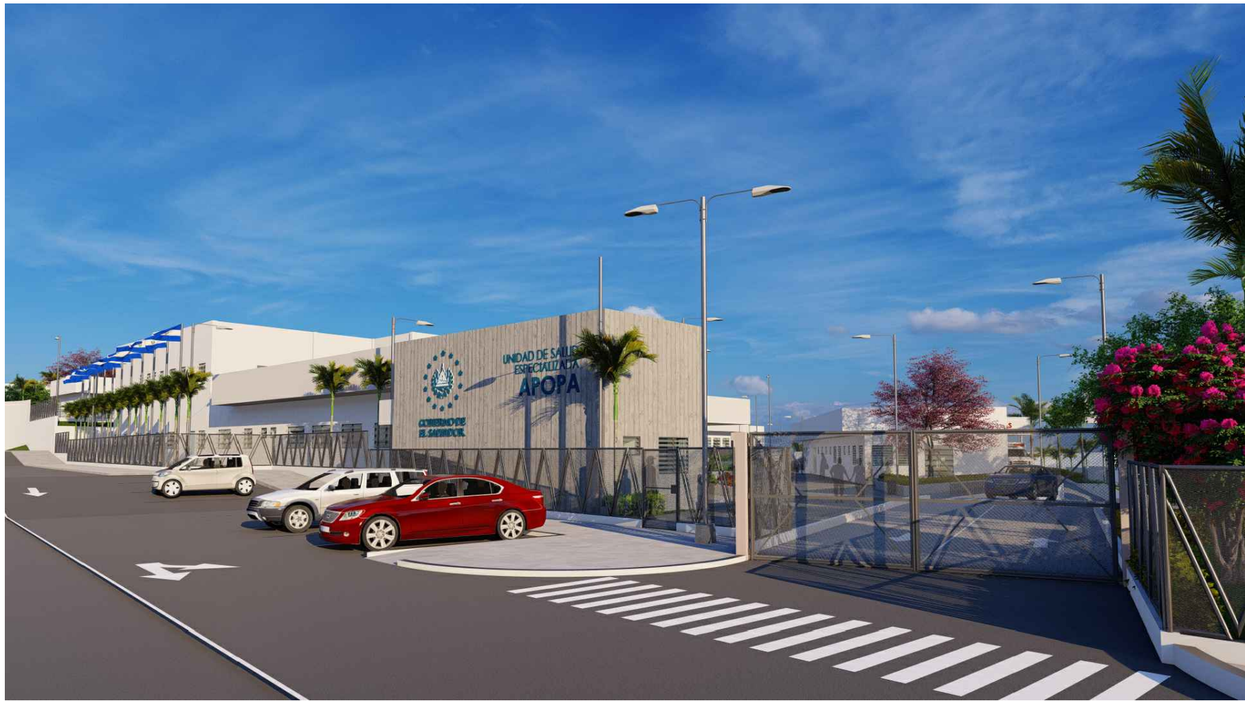
PERSPECTIVA HACIA ACCESO PEATONAL Y VEHICULAR