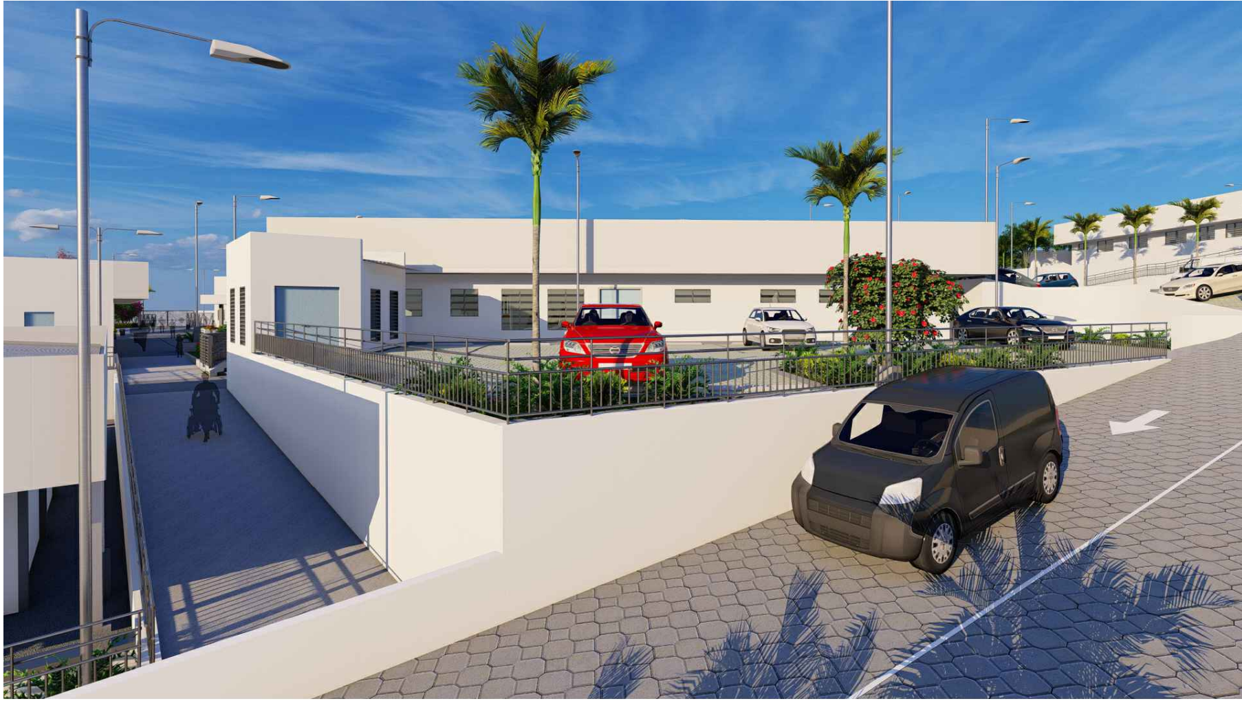
PERSPECTIVA HACIA CASETA DE BOMBEO, MÓDULO PRINCIPAL Y ESTACIONAMIENTO PERSONAL UNIDAD DE SALUD