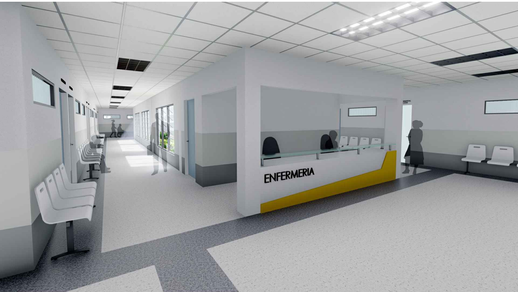
PERSPECTIVA HACIA ESTACIÓN DE ENFERMERÍAS CONSULTORIOS MÓDULO 1