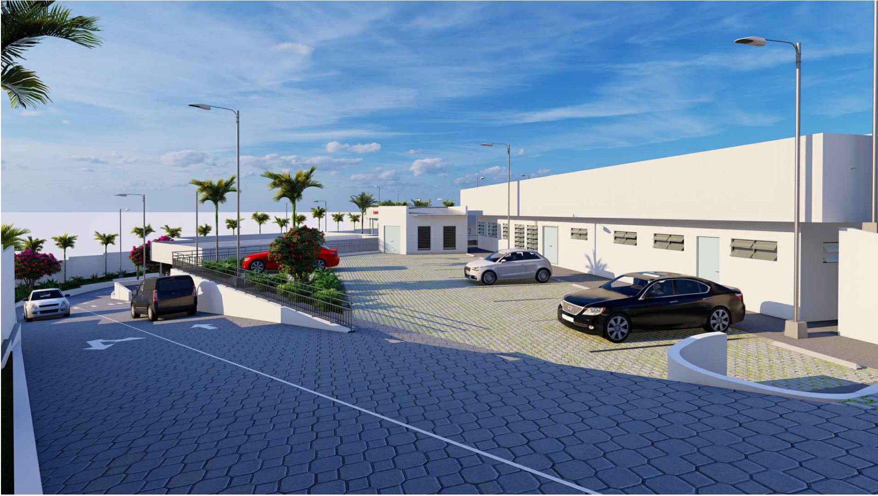
PERSPECTIVA HACIA ESTACIONAMIENTO UNIDAD DE SALUD