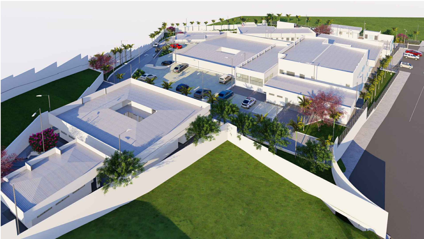
PERSPECTIVA AÉREA DE UNIDAD DE SALUD ESPECIALIZADA APOPA