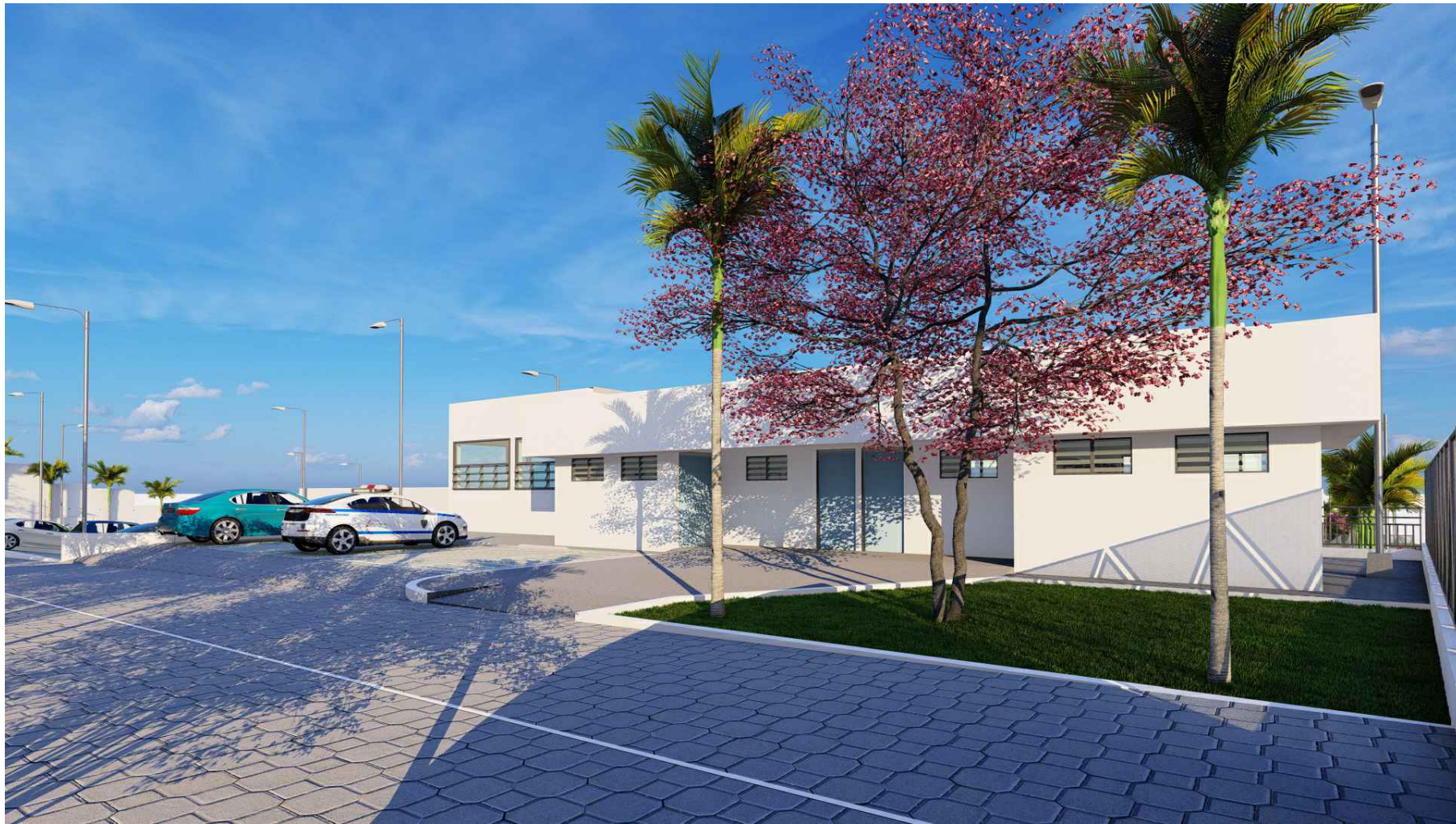
PERSPECTIVA HACIA ESTACIONAMIENTO INSTITUCIONAL SIBASI Y BODEGAS SIBASI