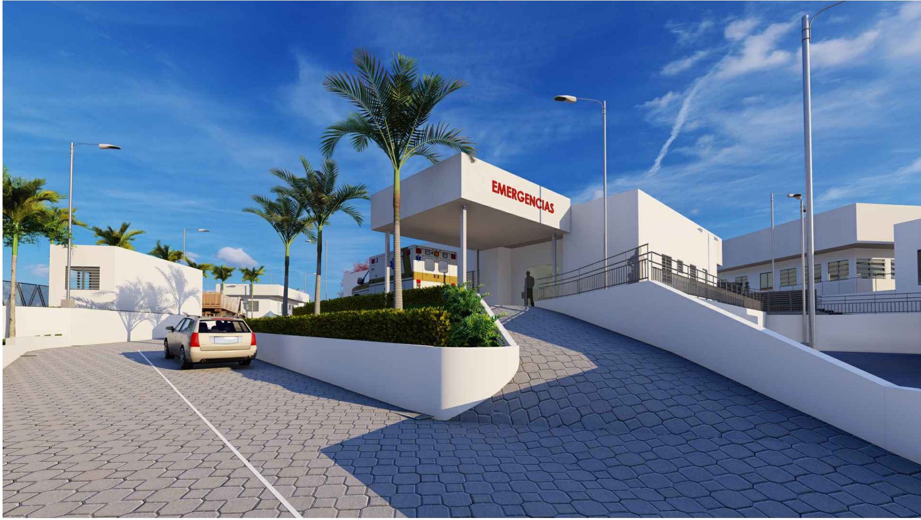
PERSPECTIVA HACIA ACCESO AMBULANCIA EMERGENCIAS