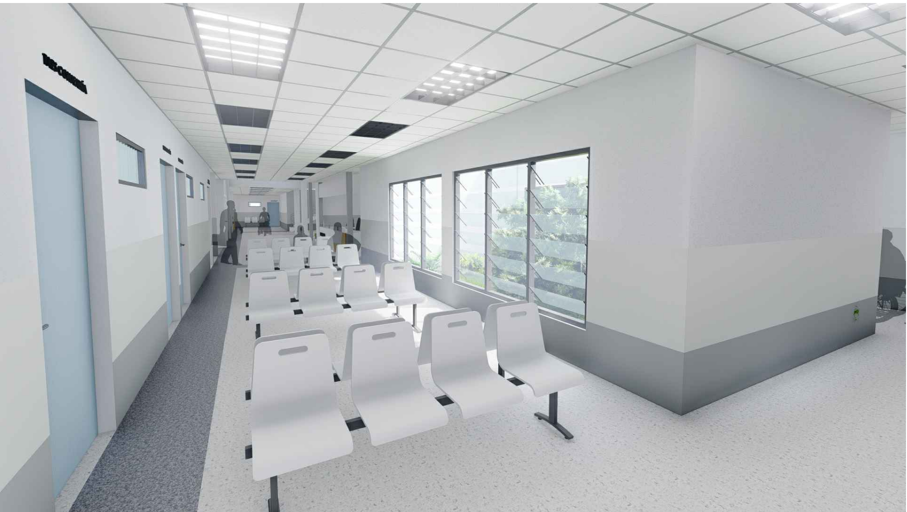
PERSPECTIVA HACIA SALA DE ESPERA MÓDULO 1