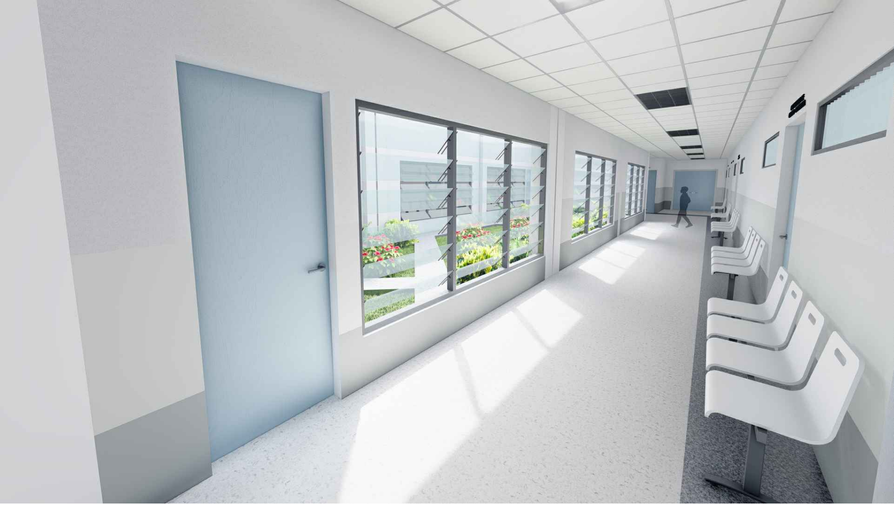
PERSPECTIVA HACIA SALA DE ESPERA DE CONSULTORIOS MÓDULO 1