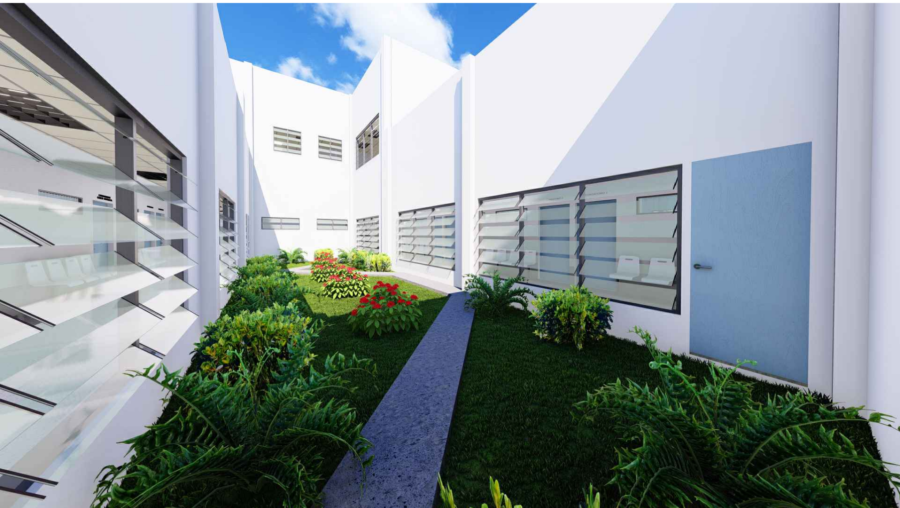
PERSPECTIVA HACIA JARDIN INTERNO MÓDULO 1