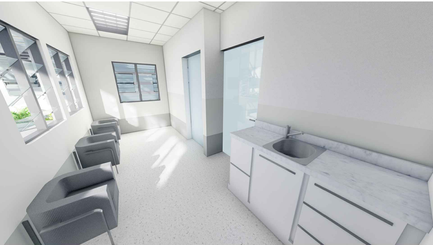
PERSPECTIVA DE EXTRACCIÓN DE LECHE MATERNA MÓDULO 1