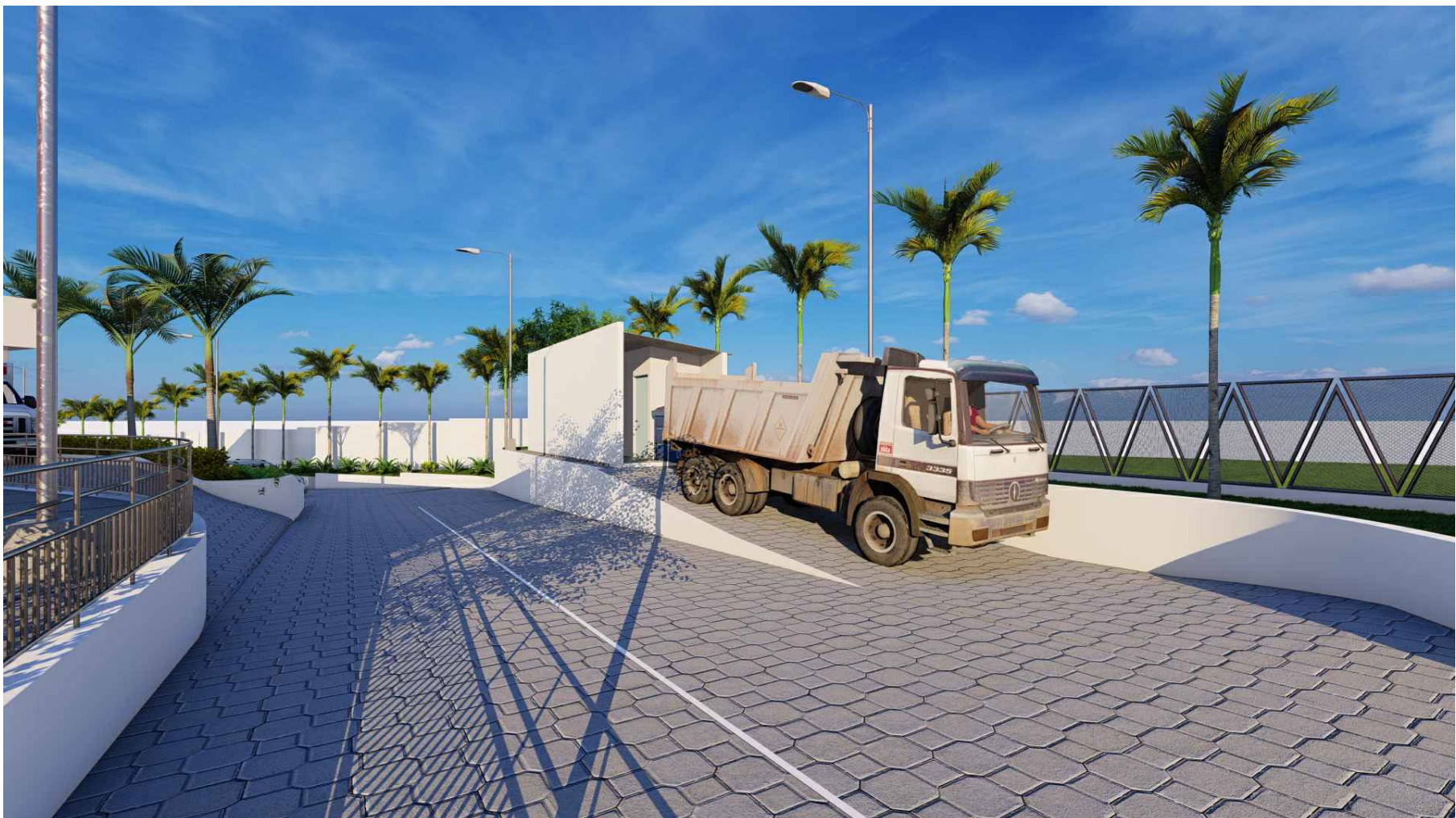
PERSPECTIVA HACIA CASETA DE DESECHOS