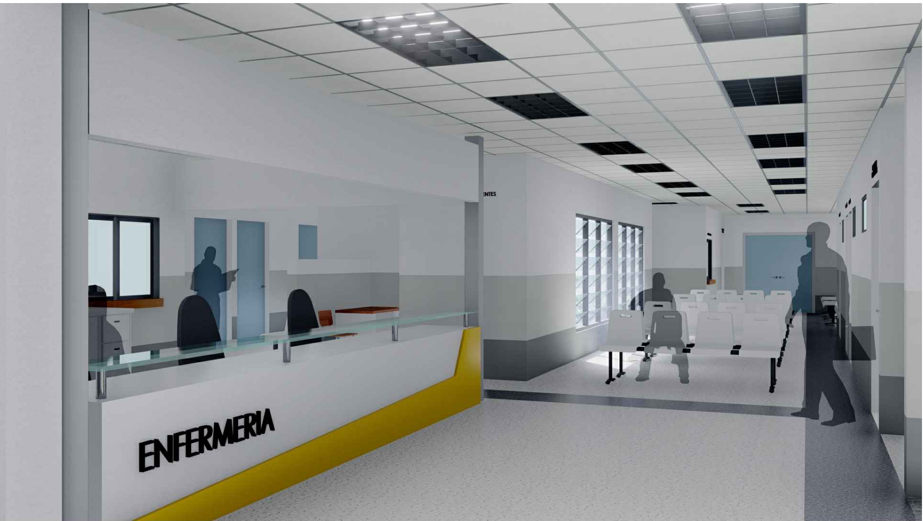
PERSPECTIVA HACIA ESTACIÓN DE ENFERMERÍA MÓDULO 1