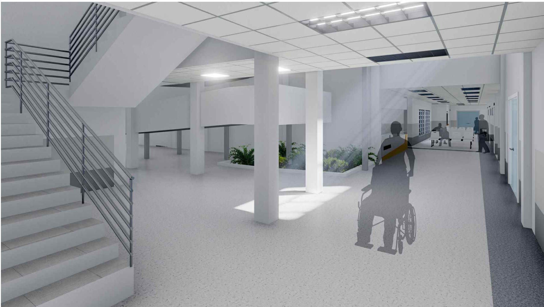
PERSPECTIVA HACIA GRADAS DE ACCESO A SEGUNDO NIVEL MÓDULO 1