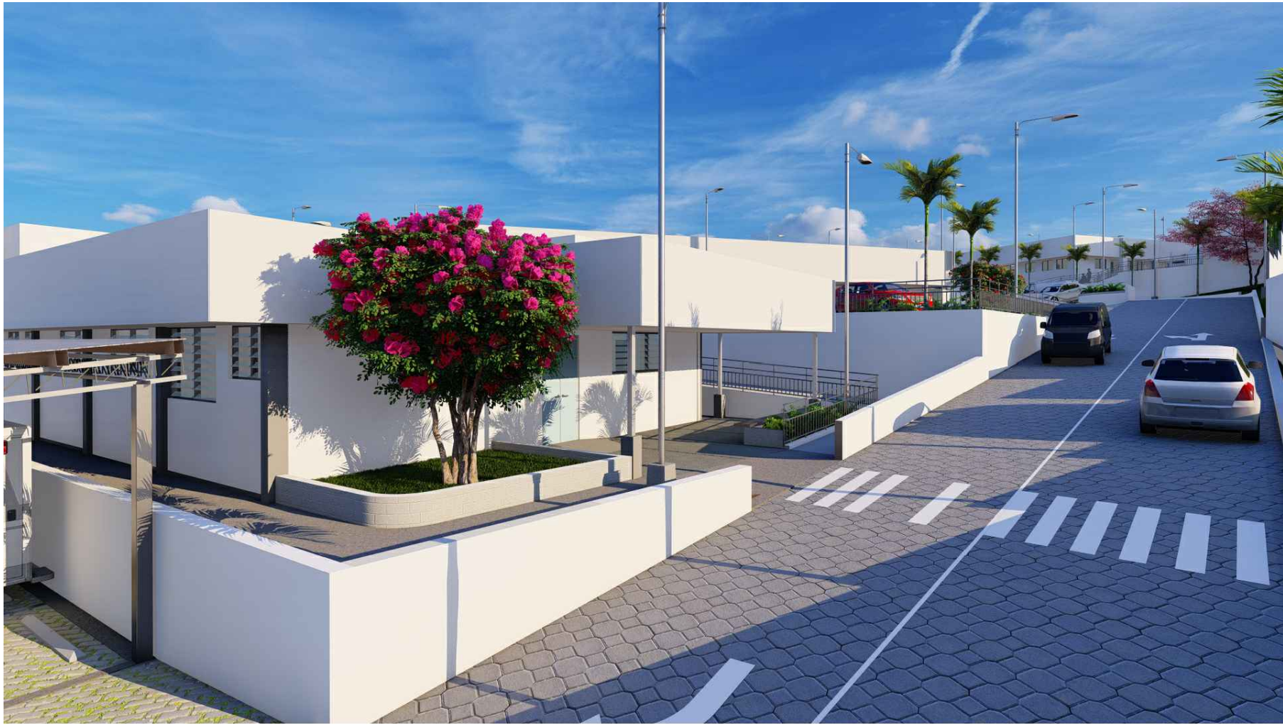
PERSPECTIVA HACIA HOGAR DE ESPERA MATERNA