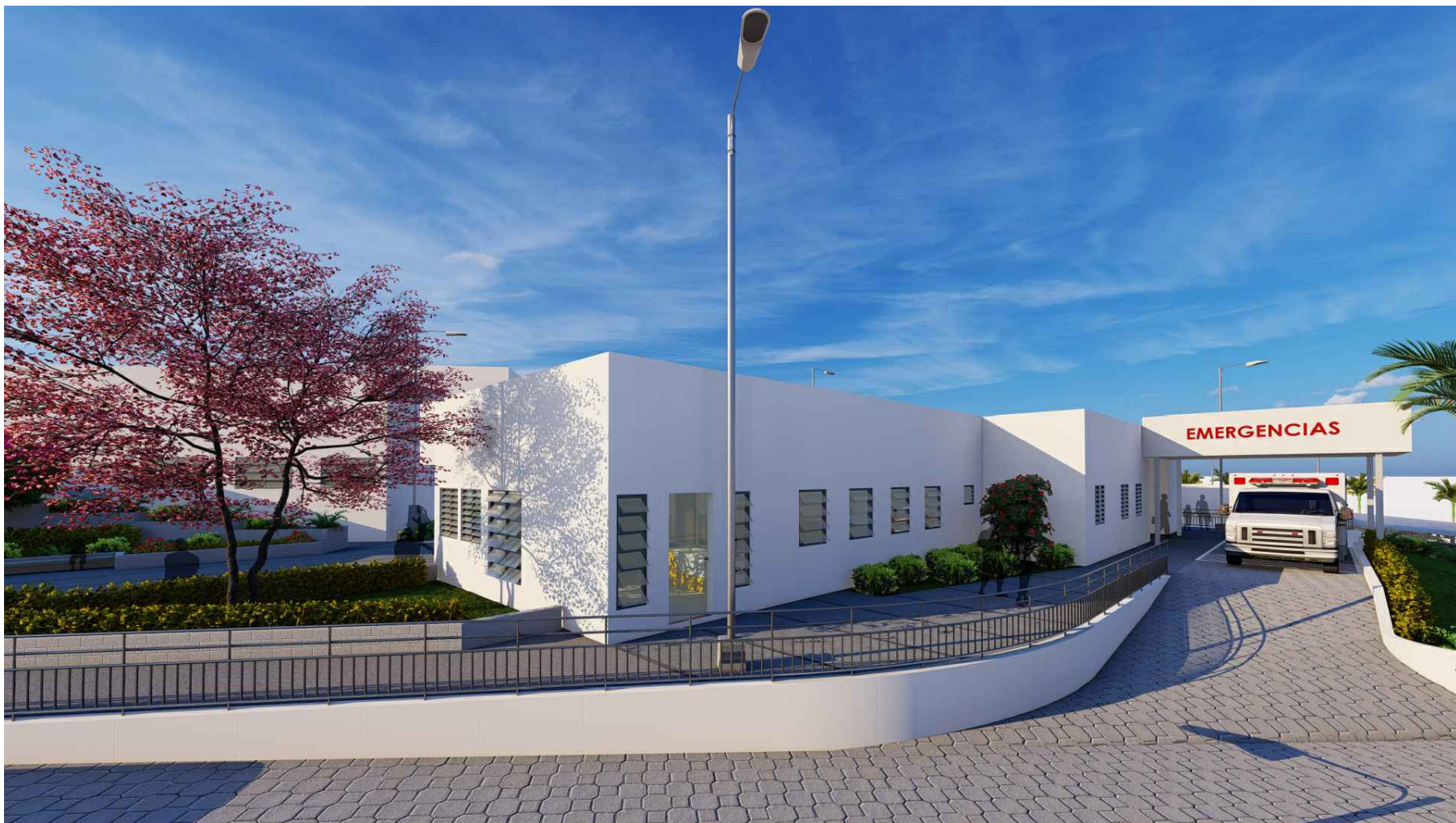
PERSPECTIVA HACIA EMERGENCIAS