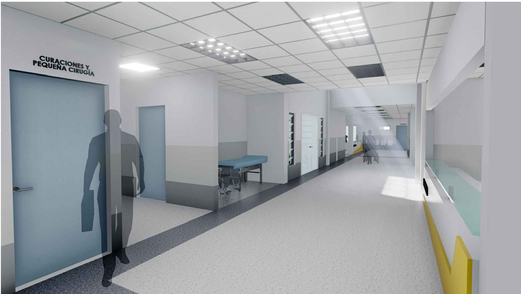
PERSPECTIVA HACIA PASILLO Y ACCESO PRINCIPAL DE MÓDULO 1