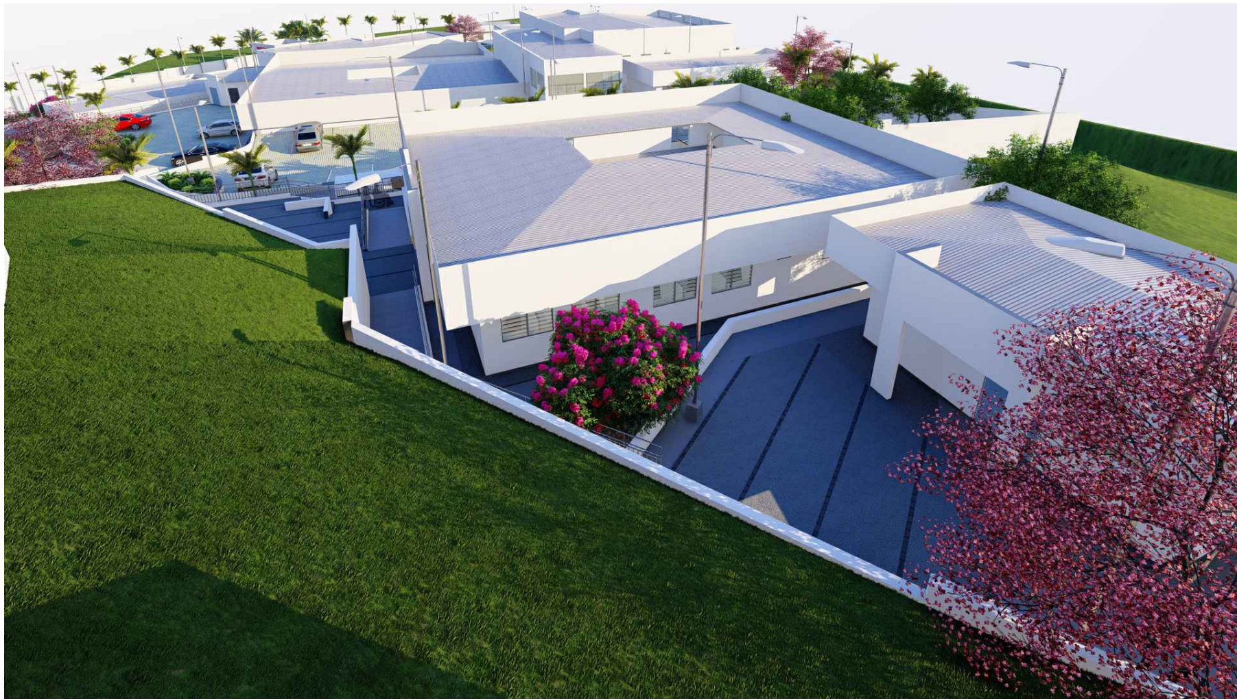
PERSPECTIVA HACIA SIBASI Y SALÓN DE USOS MÚLTIPLES SIBASI