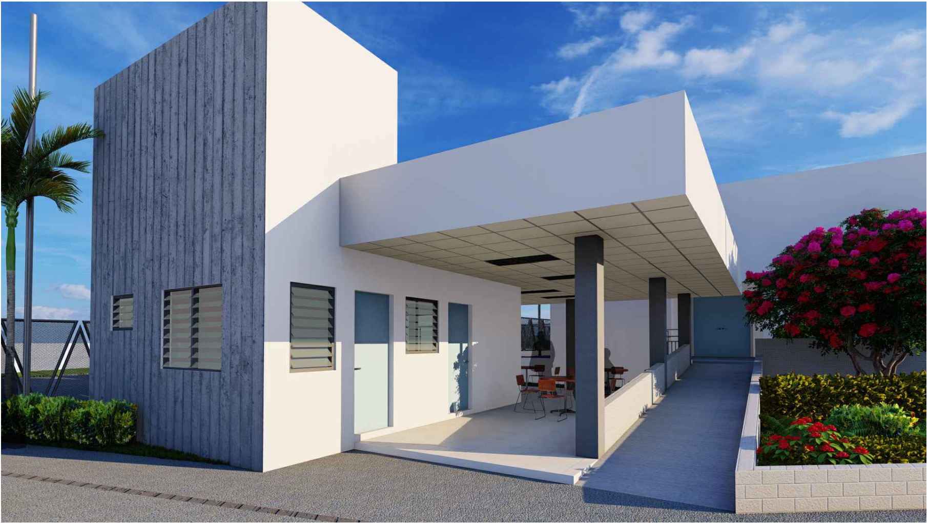
PERSPECTIVA CASETA DE VIGILANCIA Y COMEDOR