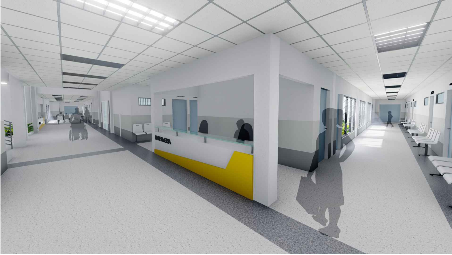
PERSPECTIVA HACIA ESTACIÓN DE ENFERMERÍA DE CONSULTORIOS MÓDULO 1