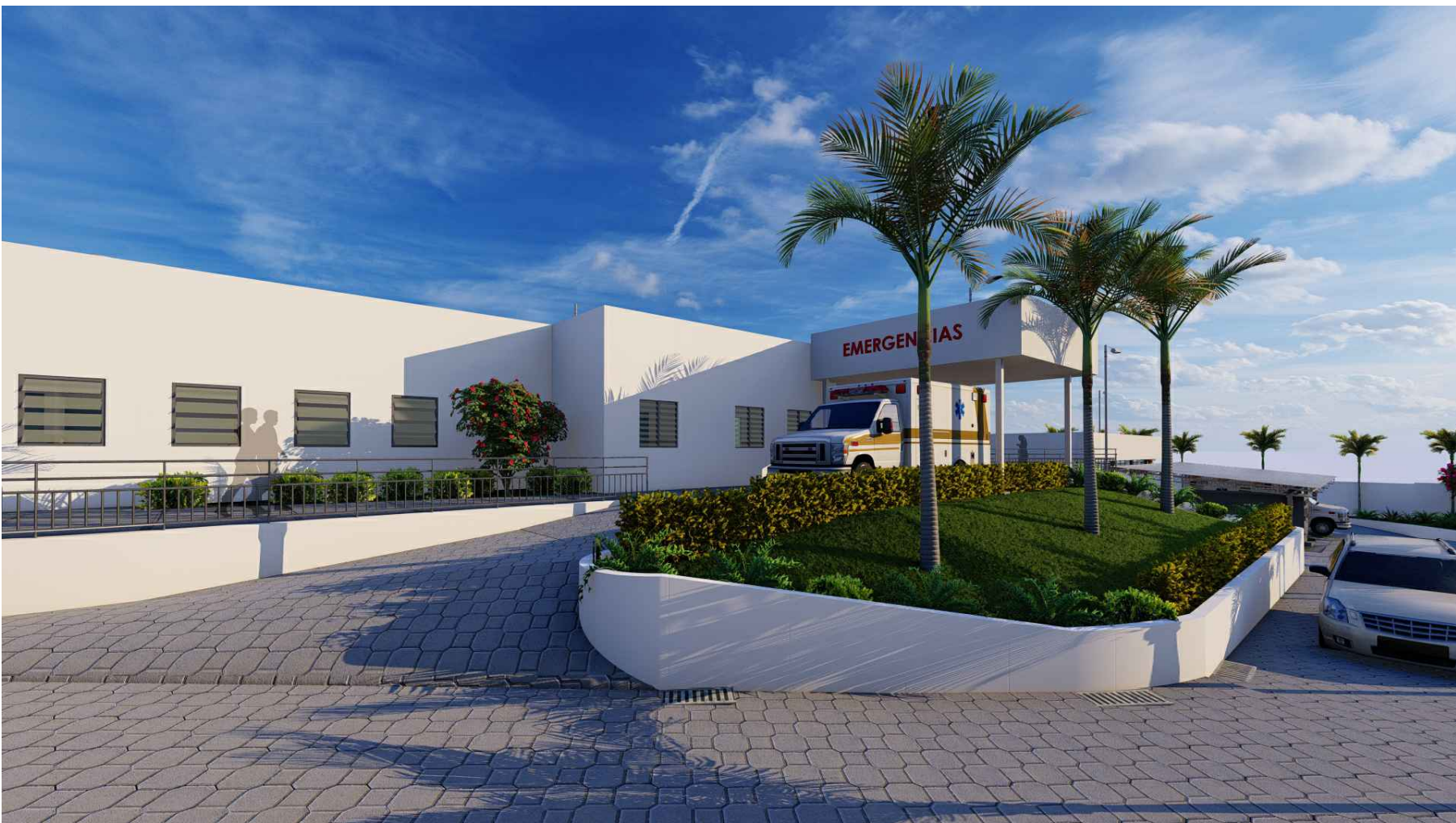
PERSPECTIVA HACIA ACCESO PEATONAL Y VEHICULAR