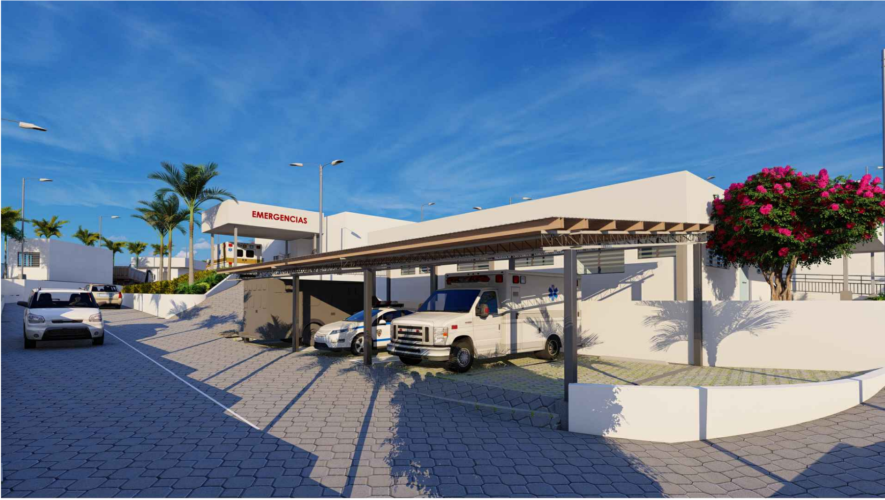
PERSPECTIVA HACIA ESTACIONAMIENTO DE AMBULANCIA