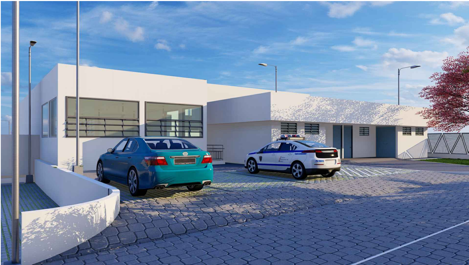
PERSPECTIVA HACIA ESTACIONAMIENTO INSTITUCIONAL SIBASI Y BODEGAS SIBASI