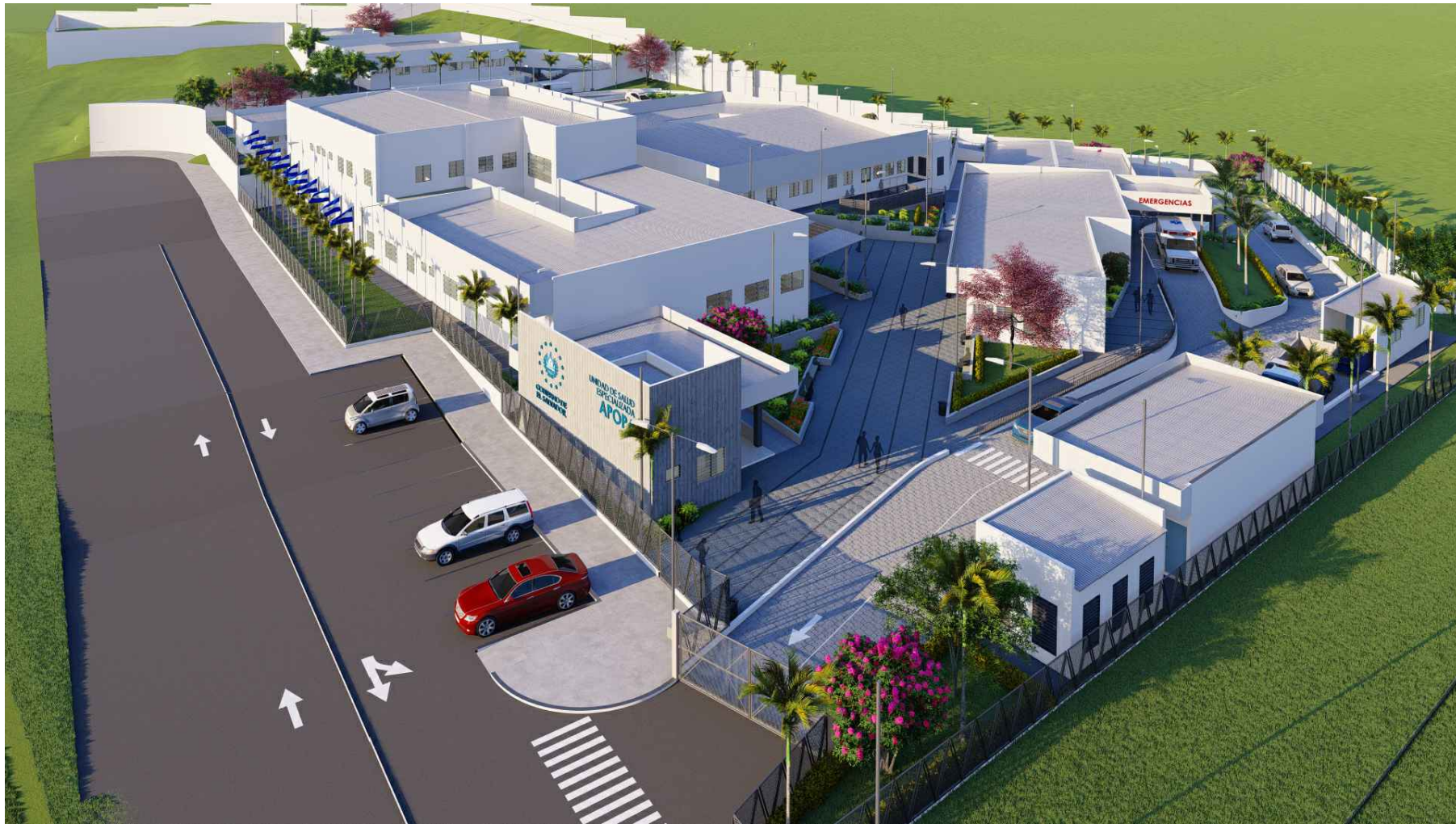
PERSPECTIVA AÉREA DE UNIDAD DE SALUD ESPECIALIZADA APOPA