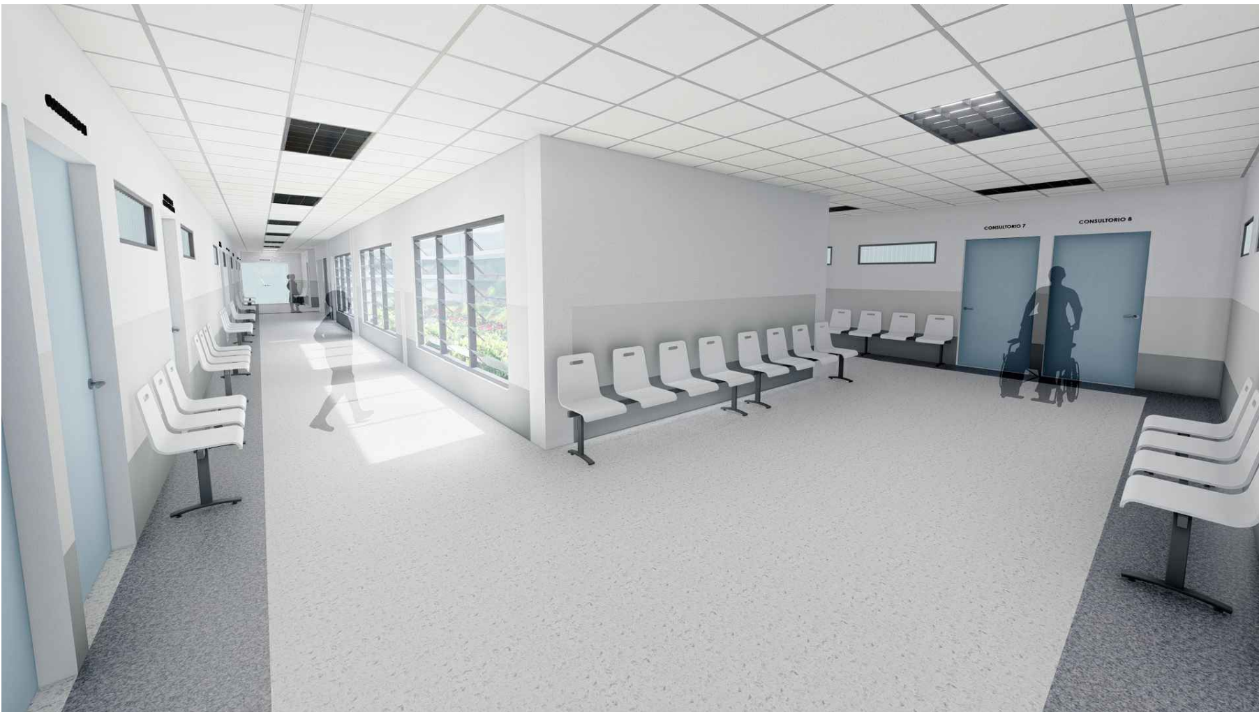
PERSPECTIVA HACIA SALA DE ESPERA DE CONSULTORIOS MÓDULO 1