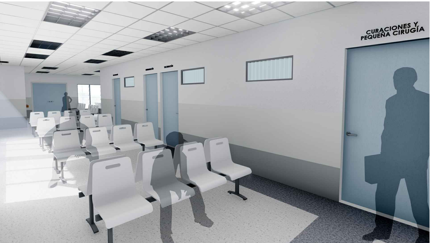
PERSPECTIVA HACIA SALA DE ESPERA Y CURACIONES MÓDULO 1