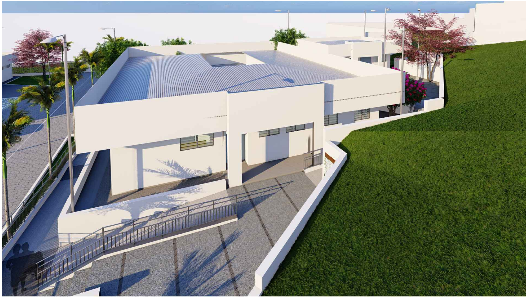
PERSPECTIVA HACIA SIBASI