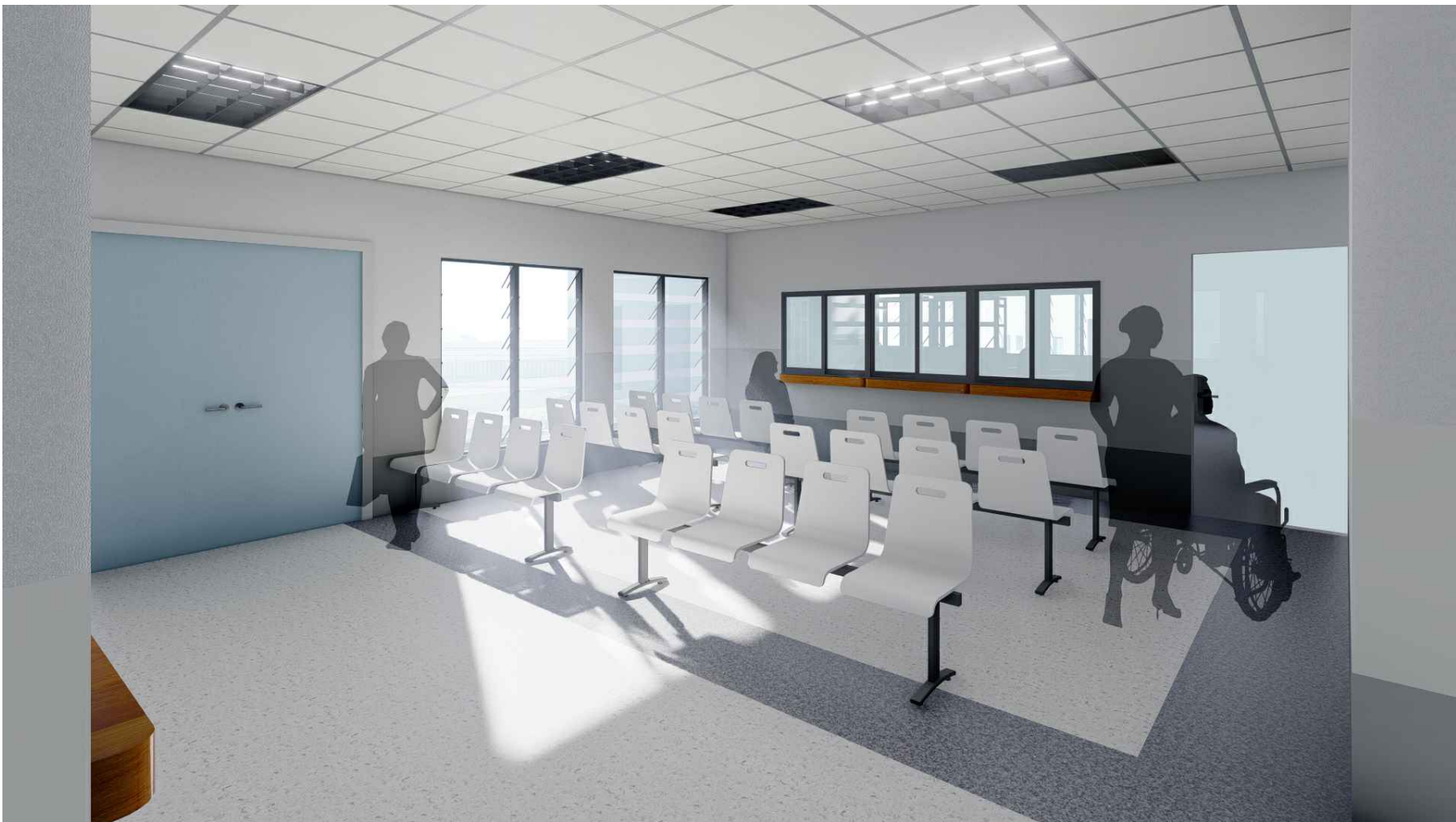
PERSPECTIVA HACIA FARMACIA MÓDULO 1