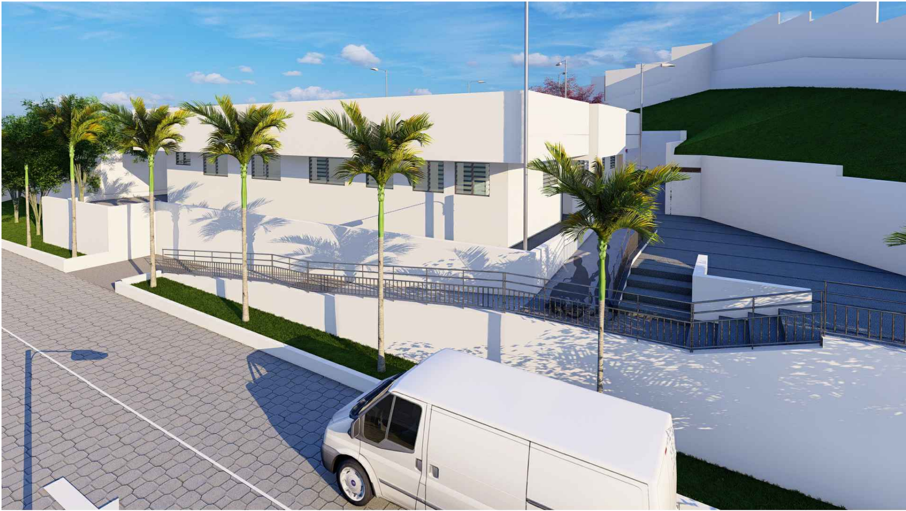
PERSPECTIVA HACIA SIBASI