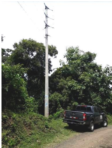
1. Poste línea primaria de distribuidora