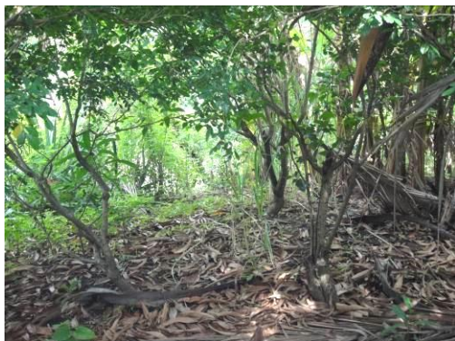
6. Ladera del terreno