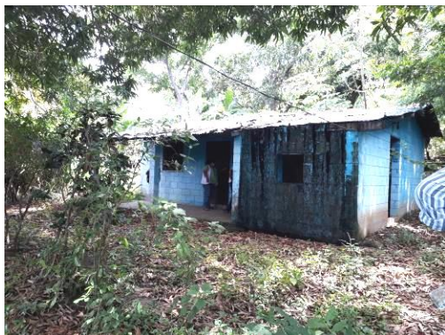
4. Casita bloque de concreto en abandono