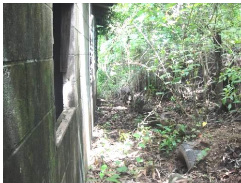
5. Vista posterior lindero del terreno