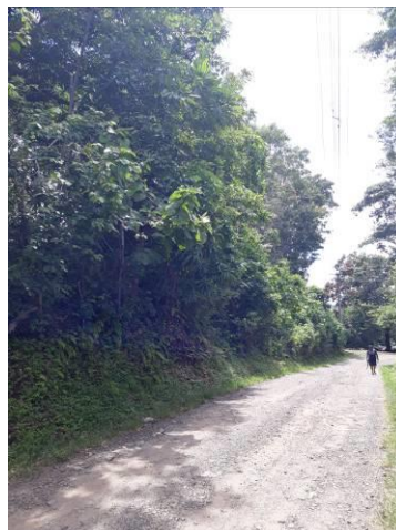
3. Calle hacia el cantón El Jutillo