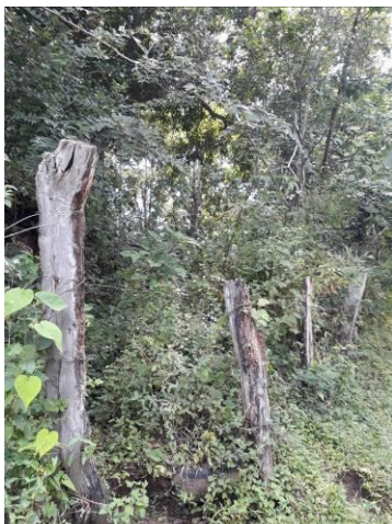
2. acceso al terreno (rampa suelo natural)