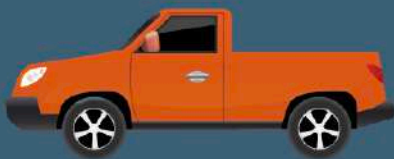
Vehículos (timón, tablero, freno, etc)