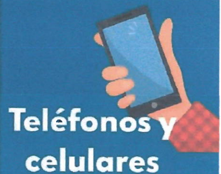
Teléfonos y celulares