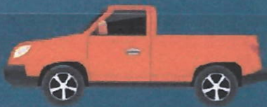
Vehículos (timón, tablero, freno, etc)