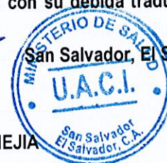
LIC. ISELA DE LOS ANGELES MEJIA JEFE UACI

RESPUESTA: Para el ítem No. 5 código MINSAL 60403380 "Microscopio Binocular", se acepta que se entregue un único documento que incluya los manuales de operación, servicio y partes, original en idioma castellano o ingles con su debida traducción fiel al idioma español.