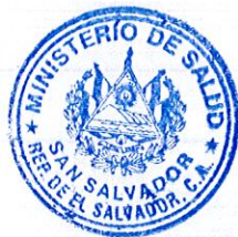
MARÍA ISABEL RODRÍGUEZ MINISTRA DE SALUD.